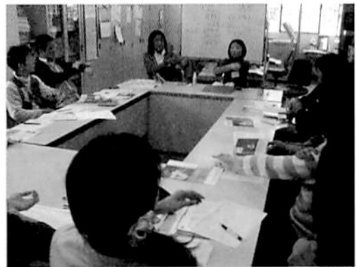
外用薬の塗り方の実演・塗る面積を測る

ついて話をしました。まず「みなさんは、ご自身の使用している薬のランクをご存知ですか」と質問をしましたが、ほとんどの方が、あまり把握されていないかたようでした。なぜ知る必要があるのかという説明を、メモをとりながら熱心に聴いてくださいました。