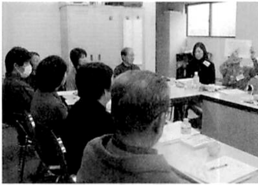
ぜんそく実践講座

ぜんそくは、薬の開発が日進月歩で次々と新薬が出ていて、ご自身に合う薬を今は見つけやすくなっているようです。その一方、患者自身がアンテナを張り巡らす必要もあるとのことでした。私はアトピー性皮膚炎の療養相談を担当していますが、今回初めてぜんそく部門に参加し、アトピー性皮膚炎との大きな違いを1つ見つけました。それは、ステロイドが「恐怖の薬」と位置づけられていることがなく、ほとんどの患者が当然として吸入